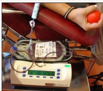
STEG 2: EFTER CIRKA FEM MINUTER HAR DU LÄMNAT FYRA OCH EN HALV DECILITER BLOD.